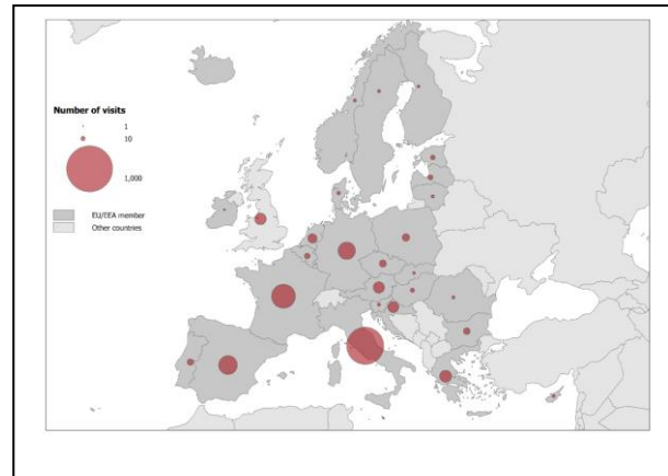
Fig.4.2-Casos asociados a viajes.

La legionelosis, como es conocido, es una enfermedad respiratoria, conocida desde 1976 en un brote ocurrido en una convención anual de miembros de una legión americana en un hotel en Filadelfia (EEUU), y que es de declaración obligatoria en más de 30 países del EEE.